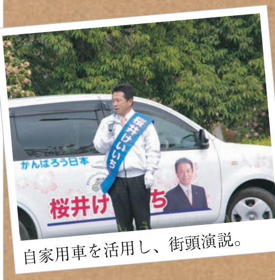
自家用車を活用し、街頭演説。