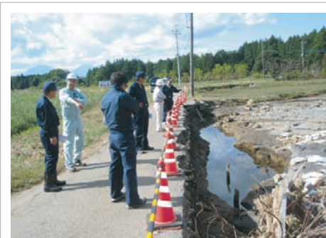
自民党議員会で現地視察