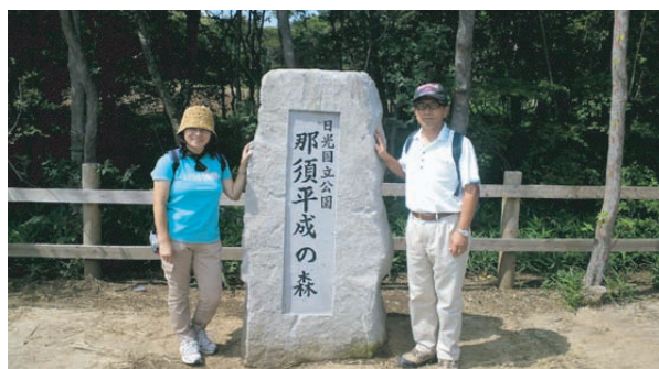
8月・那須平成の森ハイキング