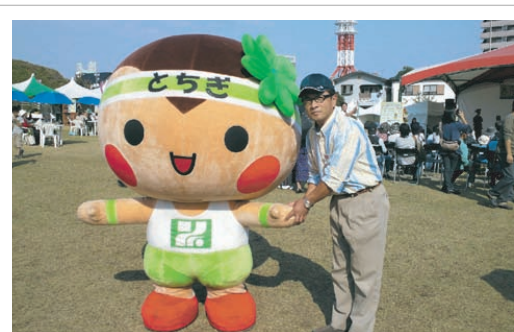
市内で開催されたイベント会場にて