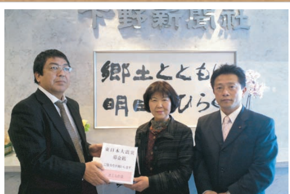
選挙戦の期間中、事務所に募金箱を設置し、下野新聞社を通して東北の被災地に義援金を送りました。