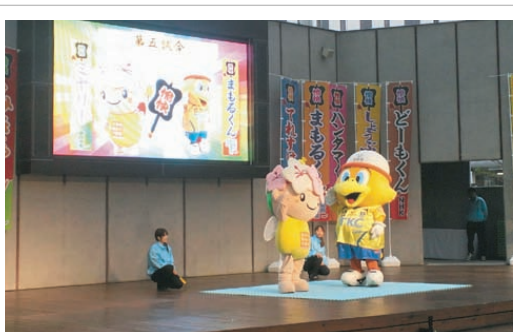
オリオンスクエアにて

昨年の11月に「全国スポレク際」が栃木県で開催され、栃木県のキャラクター「とちまるくん」が大人気となり、栃木県の「ゆるキャラ」に認定されました。