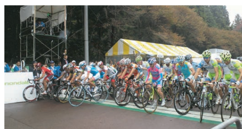
20回目のジャパンカップサイクルロードレース

大震災の復興と地域経済の活性化、教育の充実などと同時に“魅力”と“活力”ある宇都宮市をみんなで創っていきましょう。