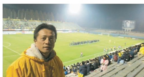
栃木SC ホームゲーム最終戦(グリーンスタジアム)