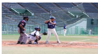
水戸市との親善野球大会