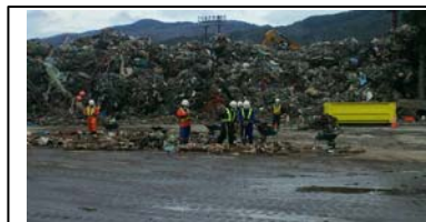
普通のがれきと違い、被災者の遺品捜査をしながら手作業で仕分けを行っていた。

本市のスピード感が無かったようにも思うところもあるが、この東日本大震災を風化させてはならない。