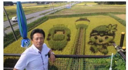
那須烏山市の田んぼアート とちまる君とスカイツリー