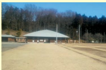
実現した環境整備

今後の道の駅としての整備について、具体的にどのようなことを実施するのか。また、にぎわい広場において、本市や地域の事業など様々なイベントを実施しているが、悪天候により歩けないほどの悪い状況である。暗渠排水などの環境整備の充実を実施する必要があると考えるが見解を伺う。