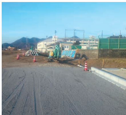
市道6193号線(晃陽中西側)