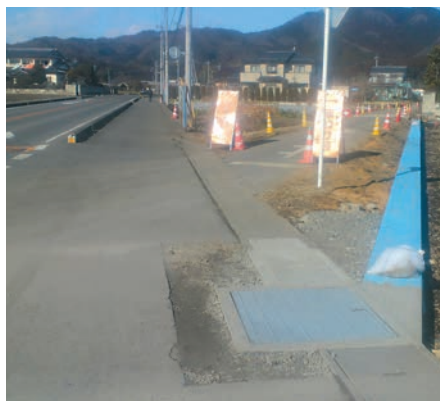
市道604号線(新里町地内)