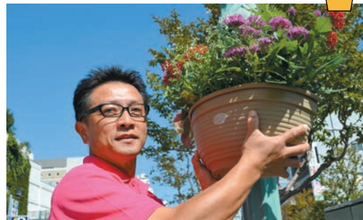
まちなかハンギングバスケット