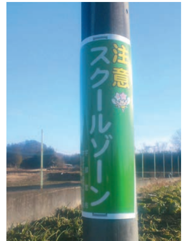
スクールゾーン標識設置

全国的に登下校中の児童の列に車が突っ込むなど、残念な交通事故が多く発生している。学校、PTA、地域の皆様に立哨や見守りを実施して頂いているが、早急な対策が必要でありどのように対応していくのか。また、学校周辺の一定エリアと通学路を「スクールゾーン」と位置づけし、速度制限の強化や道路標識の設置、安全面での路面標示などを実施してはどうか伺う。